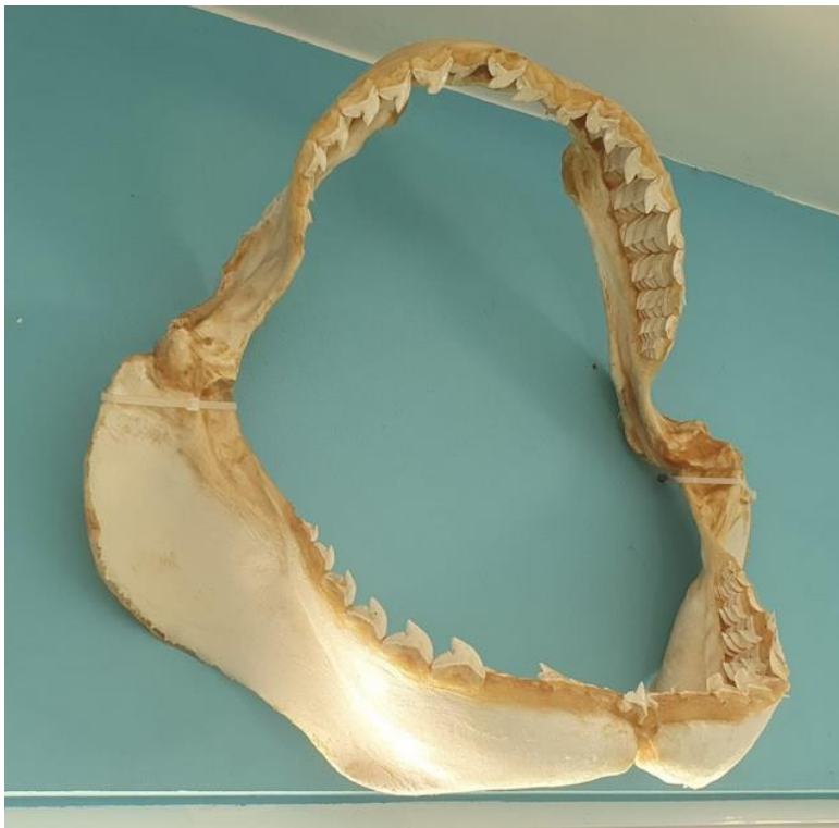
Gebit van een haai, decoratie in het restaurant van de Maio Fishing Club.